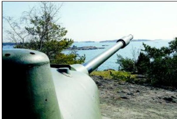
Djupt nere i berget laddas ammunitionen och skickas upp till till de tre soldater som bemannar kanonen uppe vid värnet.