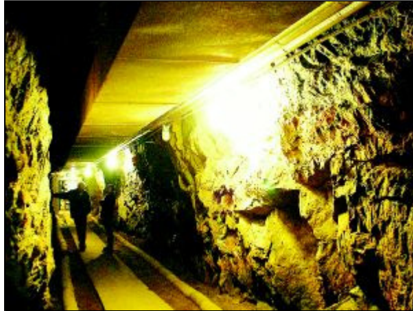
Bråvikens mynning vaktas av sammanlagt tre stycken Boforskanoner. Uppdraget för Femöre-fortet var bland annat att försvara inloppet till Norrköping.